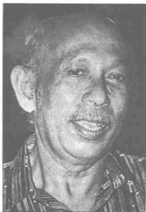
Tan Sri Senu Abdul Rahman

Pada hari Selasa yang lalu, ada dua orang menteri kabinet, ramai yang menyokong UMNO 46 dan ada pemimpin yang enggan menyertai UMNO (baru) dan beliau memberitahu saya dan orang-orang yang ada di meja kami kenapa beliau berbuat demikian; tetapi saya berasa gembira kerana mereka dapat bertegur sapa, bermesra, sindir-menyindir dan gelak ketawa. Inilah tradisi UMNO yang saya tahu.