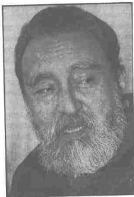
Prof. Syed Hussein Al-Attas

Tetapi kalau banyak benar tenaga dihabiskan dengan kerja-kerja yang tidak berfaedah tentulah banyak lagi kerja yang terbengkalai. Kerja kuat sahaja pun tidak memadai; otak dan fikiran hendaklah digunakan selalu.