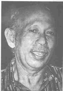
Tan Sri Senu Abdul Rahman

Pada hari Selasa yang lalu, ada dua orang menteri kabinet, ramai yang menyokong UMNO 46 dan ada pemimpin yang enggan menyertai UMNO (baru) dan beliau memberitahu saya dan orang-orang yang ada di meja kami kenapa beliau berbuat demikian; tetapi saya berasa gembira kerana mereka dapat bertegur sapa, bermesra, sindir-menyindir dan gelak ketawa. Inilah tradisi UMNO yang saya tahu.