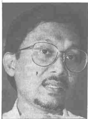
Encik Anwar Ibrahim