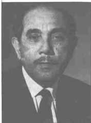
Allahyarham Syed Jaafar Albar