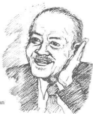
Regu Pertama Tengku Abdul Rahman - Tun Razak