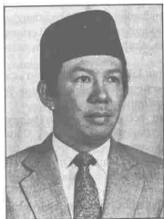
Dato' Musa Hitam