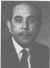
Allahyarham Syed Jaafar Albar