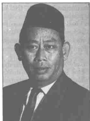
Allahyarham Tun Sardon