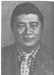
Datuk Seri Dr. Lim Liong Sik