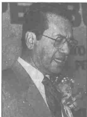
Dato' Sri Dr Mahathir