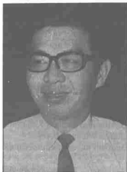
Dato' Seri Dr. Lim Keng Yaik