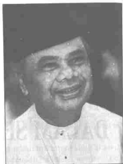
Encik Ghaffar Baba