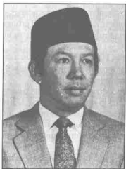
Dato' Musa Hitam