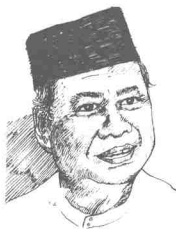
Regu Keenam Dato' Sri Dr Mahathir - En Ghaffar Baba