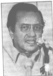
Dato' Sri Dr. Mahathir