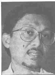
Encik Anwar Ibrahim