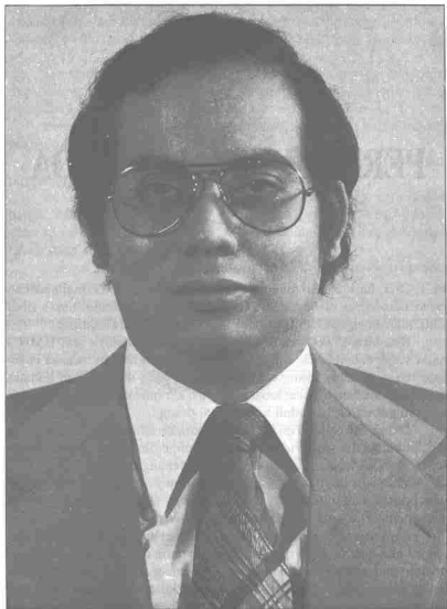
Dato Sri Najib Tun Razak