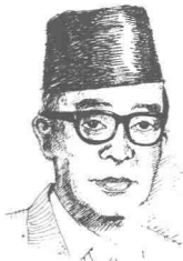
Regu Ketiga Tun Razak - Dato' Hussein Onn