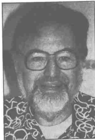
Prof. Di Raja Ungku Aziz