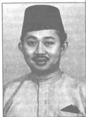
Tengku Razaleigh Hamzah