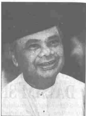
Encik Ghaffar Baba