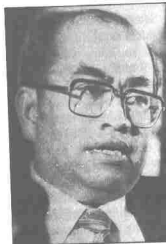
Dato' Sanusi Junid