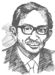
Regu Kedua Tun Razak - Tun Dr Ismail