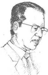
Regu Keempat Dato' Hussein Onn - Dato' Dr Mahathir