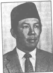
Datuk Musa Hitam