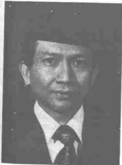
Dato' Rais Yatim