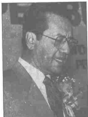
Dato' Sri Dr Mahathir