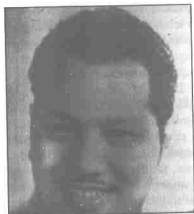
Allahyarham P. Ramlee

Saya harap mereka sentiasa sedar bahawa mereka berada dalam satu keluarga seni yang satu memerlukan yang lainnya.