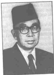
Allahyarham Tun Razak

Itulah sebabnya ada masanya saya 'malas' untuk mengeluarkan pendapat di khalayak ramai. Mungkin bila bersara nanti saya akan tulis buku, tetapi bukan sebagai penulis upahan.